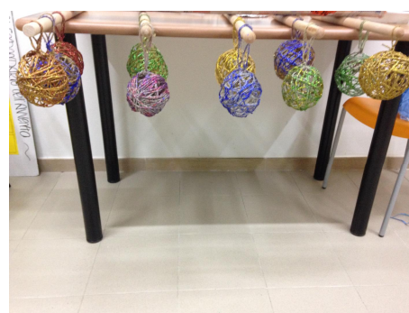
Ecco le palle di natale finite