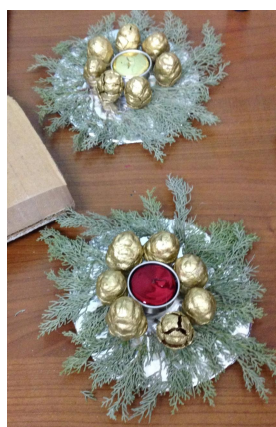
Ecco i nostri centro tavola per le feste