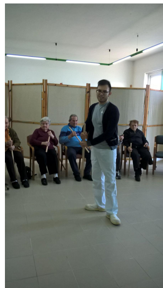
Ginnastica con i bastoni

In queste poche righe ho espresso l'importanza del movimento, nella nostra R.S.A, gli esercizi vengono svolti subito dopo la colazione, tutti gli ospiti formano un semi cerchio nella sala dedicata all'animazione ed iniziamo il nostro riscaldamento